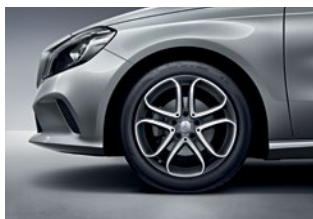
A 200 Style 225/45 R 17

Las llantas son un elemento técnico imprescindible en cualquier vehículo, pero tienen también su importancia a nivel emocional: pocos detalles son tan relevantes como elegir los rines perfectos para su vehículo soñado.